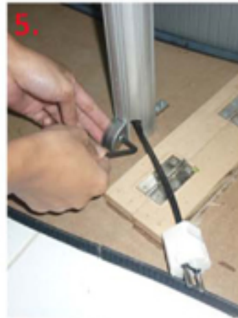
5. Kunci Tiang ke Base dengan Kunci S01