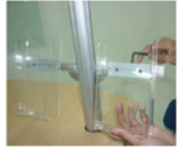
Pasang Rak Brosur Flyer ke Tiang Brosur dengan Kunci S01