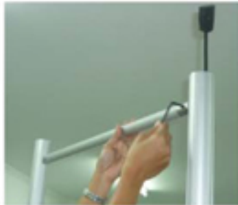
Pasang Tiang S08 ke Tiang S09