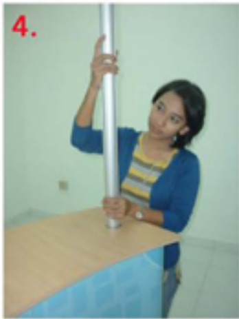
4. Masukkan Tiang ke Lubang di Table Top