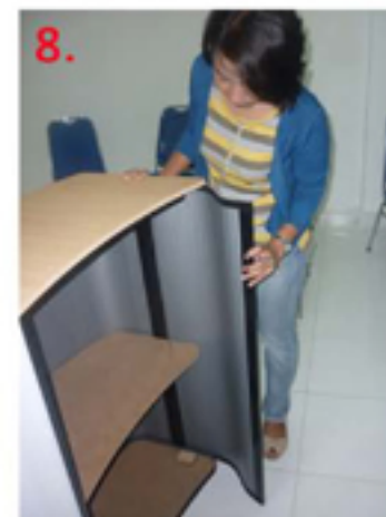
8. Rekatkan Flexisheet no.1 pada Table Top dan Base