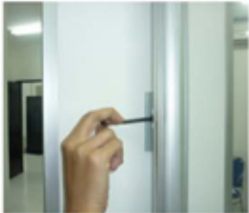
Pasang Click Frame ke Tiang S09 dengan Kunci S03