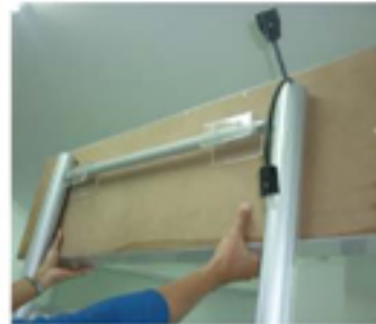
Pasang Header ke Tiang S08