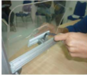
Pasang Rak Brosur A4 ke Tiang Brosur dengan Kunci S03