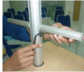
Pasang Tiang Brosur Flyer ke Tiang S09 dengan Kunci S01