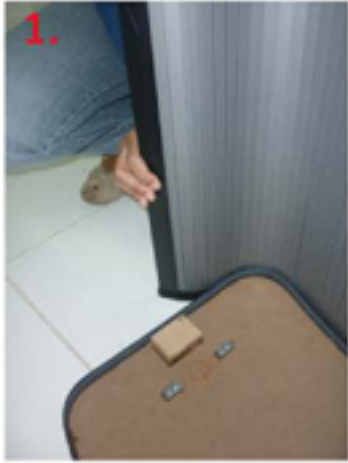
1. Rekatkan Flexisheet no.2 pada base