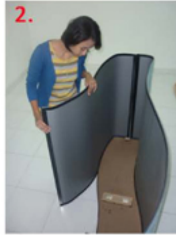
2. Rekatkan Flexisheet no.3 pada base