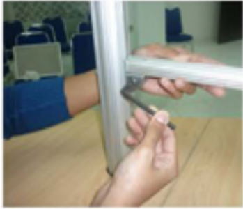
Pasang Tiang Brosur A4 ke Tiang S09 dengan Kunci S01