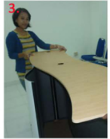
3. Pasang Table Top